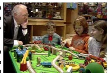
Comisario Europeo de Empresa e Industria, Günther Verheugen, responsable de la propuesta de la Comisión Europea.

http://ec.europa.eu/prelex/detail_dossier_print.cfm?CL=es&Dosl